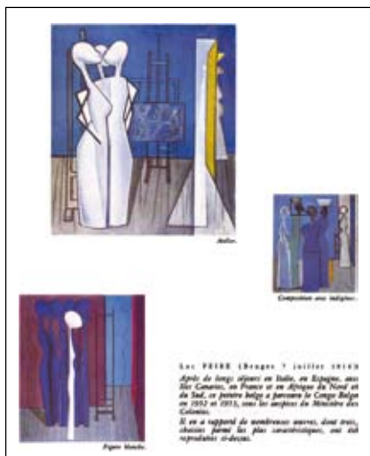
Binnenzijde nieuwjaarskaart 1955 van de Bank van Parijs en de Nederlanden (27 x 20 cm) met de reproductie van Atelier (1953, CR 548), La figura blanca (1953, CR 552) en Composition avec indigènes (1952, CR 508). Archief Stichting Jenny & Luc Peire, Knokke.

bankgebouw aan de Brusselse Koloniënstraat op originele wijze te decoreren. Naessens verwerft Atelier (1953, CR 548) en La figura blanca (1953, CR 552) en hangt ze meteen op een prominente plaats in zijn persoonlijk bureau. Deze Congolees geïnspireerde schilderijen passen perfect in de publiciteit die de Bank op dat ogenblik voert naar aanleiding van de opening van haar nieuw filiaal in de Kolonie. Daarbij hoort ook Naessens' opmerkelijk initiatief om ze af te beelden op de nieuwjaarskaart 1955 van de Bank. Het idee om eigentijdse kunstwerken in een opvallend moderne lay-out te gebruiken voor nieuwjaarswensen is in die tijd, zeker in strakke bancaire middens, ongezien. Voor het eerst gebruikt Naessens kunst om zijn Bank naar buiten te profileren. De dynamiek van de instelling wordt er op originele wijze mee aangetoond en het werk van Peire nationaal en internationaal gepromoot.