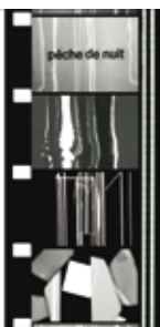
Pêche de Nuit (1963). Fotogram van Jean Mil

Boek + DVD Luc Peire's Environment kan besteld worden voor € 27 (verzendingskosten inbegrepen) via KBC-rekening 738-0104357-07 (IBAN: BE74 7380 1043 5707 / BIC: KREDBEBB) van Stichting Jenny & Luc Peire, De Judestraat 64, B-8300 Knokke-Dorp.