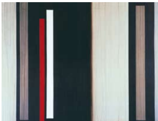
Luc Peire. Marcinelle (1956, CR 650). Collectie Dexia Bank (B).

Het werk van Peire is in het boek van Seuphor vertegenwoordigd met een groot aantal kleurafbeeldingen en hangt ook prominent op de hierbij aansluitende tentoonstelling in het Hessenhuis van 14 december 1963 tot 19 januari 1964. 18 Het jaar daarop zorgt Naessens er opnieuw voor dat de publicatie van Seuphors kleine monografie Luc Peire bij Desclée De Brouwer gepaard gaat met een expositie in de Brugse lokalen van de Financieringsbank , filiaal van zijn Bank. 19 De bankier organiseert weerom een indrukwekkende receptie en opent 'met zijn typische gave voor de causerie deze tentoonstelling' . 20 Wanneer het invloedrijke Connaissance des arts (Parijs) in 1966 naar de voor hem tien belangrijkste kunstenaars van het moment vraagt, schuift Naessens opnieuw Luc Peire als één van hen naar voor.